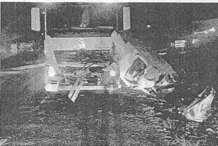
La furgoneta blanca quedó destrozada tras el choque contra el camión.

El chófer del camión, que transportaba una cisterna de leche, intentó detener el vehículo, porque dejó una larga huella de frenada, pero no lo consiguió. Resultó ileso. El conductor de la furgoneta pudo haberse saltado un stop al no verlo debido a la niebla.